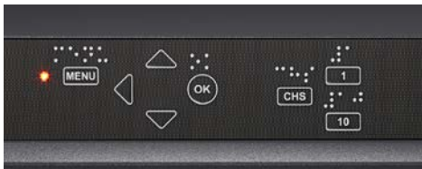
フロントパネル 操作ボタン