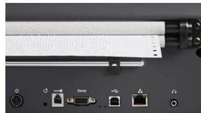
背面 インターフェイス